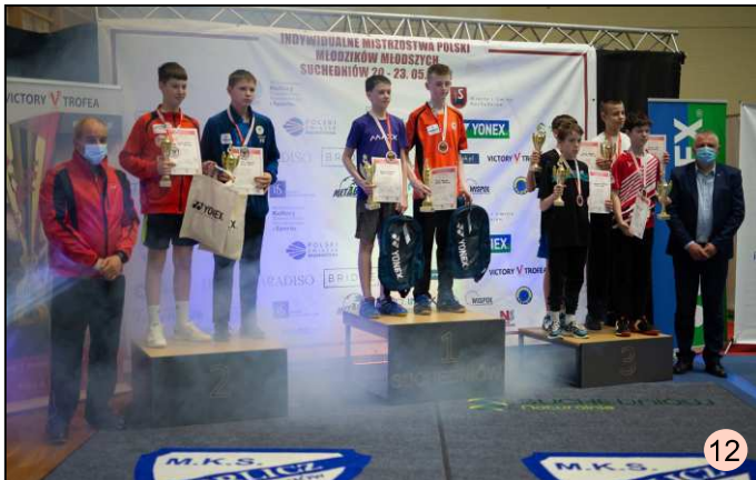
INDYWIDUALNE MISTRZOSTWA POLSKI MŁODZIKÓW MŁODSZYCH W BADMINTONIE.