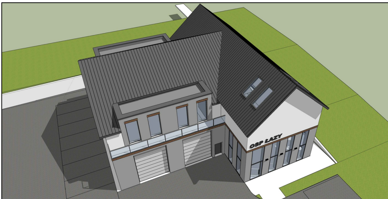
Koncepcja budynku OSP Łazy