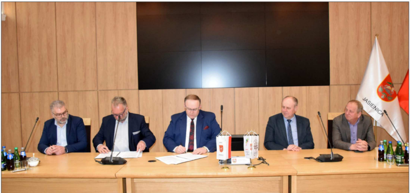
Rondo i łącznik drogowy w Jasienicy – umowa podpisana