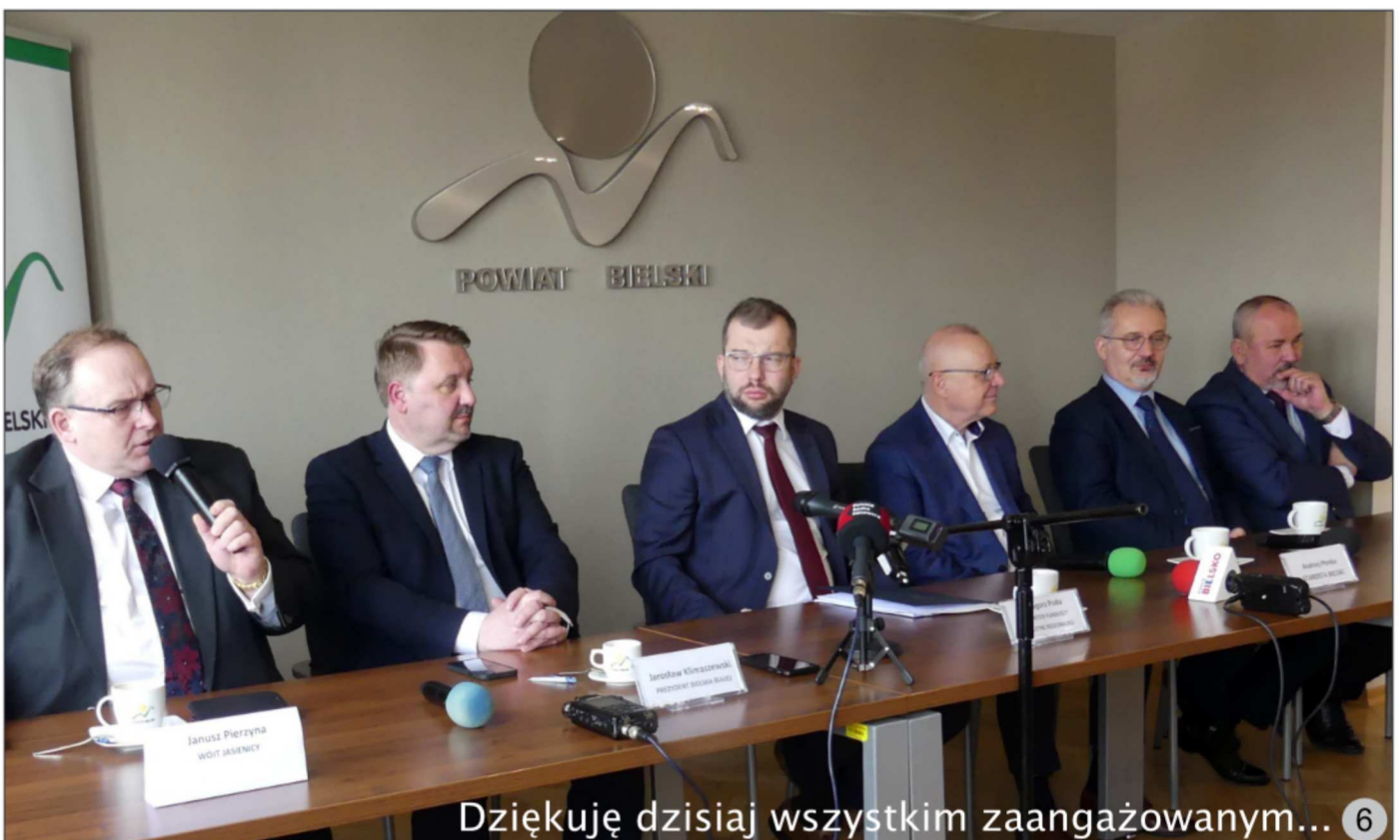
Dziękuję dzisiaj wszystkim zaangażowanym...