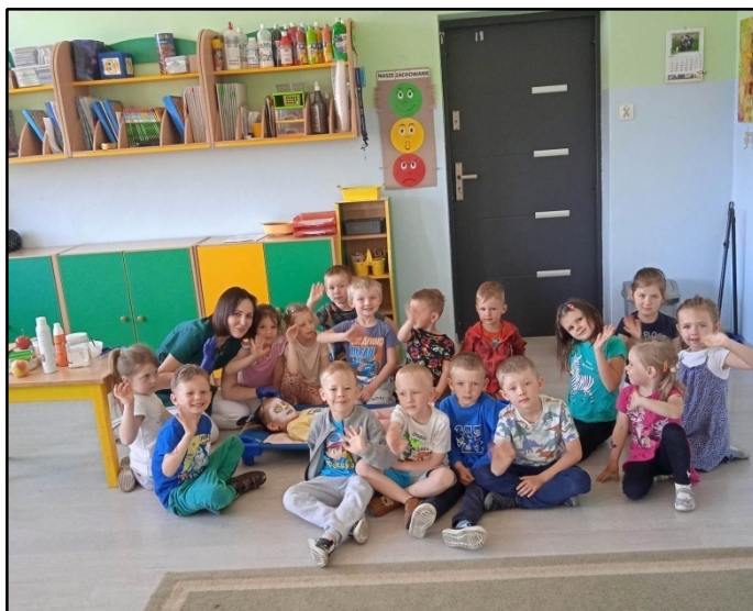
Nauczyciele przedszkola ZSP Iłownica