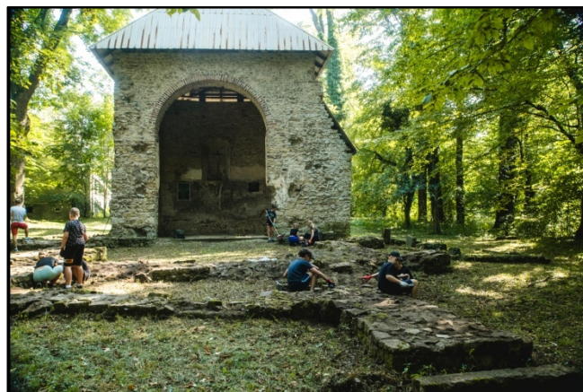
Widok ruiny w drugim dniu pracy