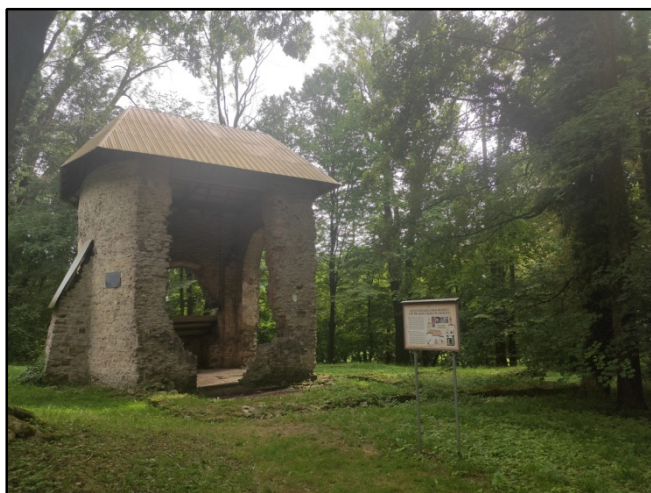
Widok ruiny przed pracami