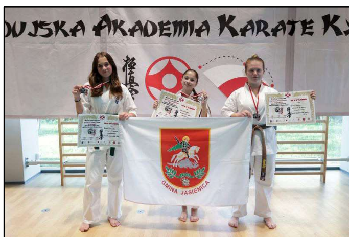
Organizatorem Mistrzostw była Świnoujska Akademia Karate Kyokushin kierowana przez sensei Pawła Sujkę, a sędzią głównym zawodów był shihan Andrzej Drewniak. .

Łącznie w zawodach wystartowało 140 karatek z 39 klubów z całej Polski.